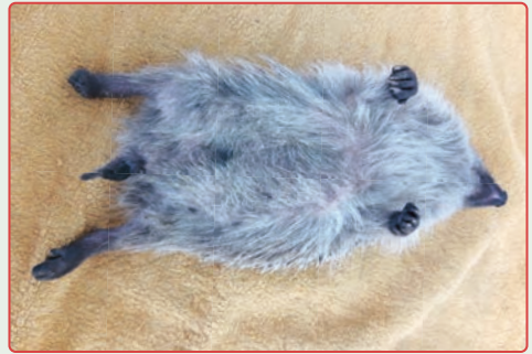
Une débroussailluse a coupé la patte de ce hérisson.