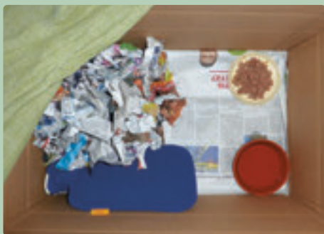
Boîte bien aménagée pour un hérisson

Mettre du papier journal dans une grande boîte solide. Attraper le hérisson avec des gants épais ou un chiffon épais et le poser dans la boîte. Couvrir la boîte avec un chiffon laissant passer l'air – pour protéger le hérisson des mouches – et l'amener dans la maison.