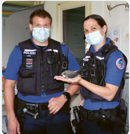
Stadtpolizei Winterthur bringt gestrandeten Alpensegler

Abstürze/Absprünge aus hitze-exponierten Bruthöhlen vor Erlangen der Flugfähigkeit, Nahrungsmangel (Insekten und Spinnen), bei Gebäudeabbrissen in Bruthöhlen gefundene Seglerküken und noch unselbstständige